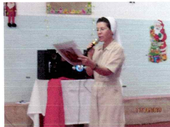
Leitura de mensagem aos participantes