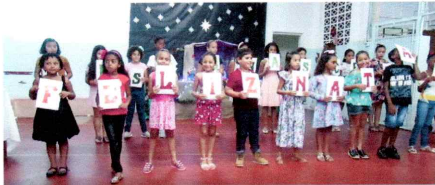
Apresentando o jogral