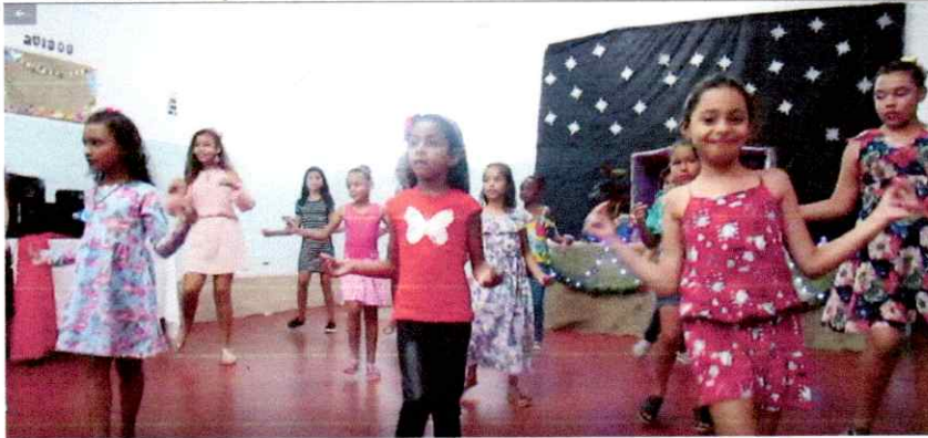
dançando a música Não Custa Nada