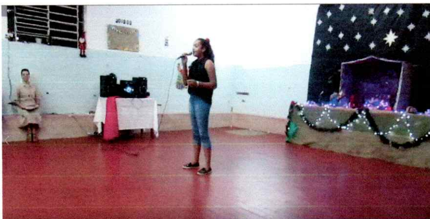
Adolescente cantando Peça Felicidade